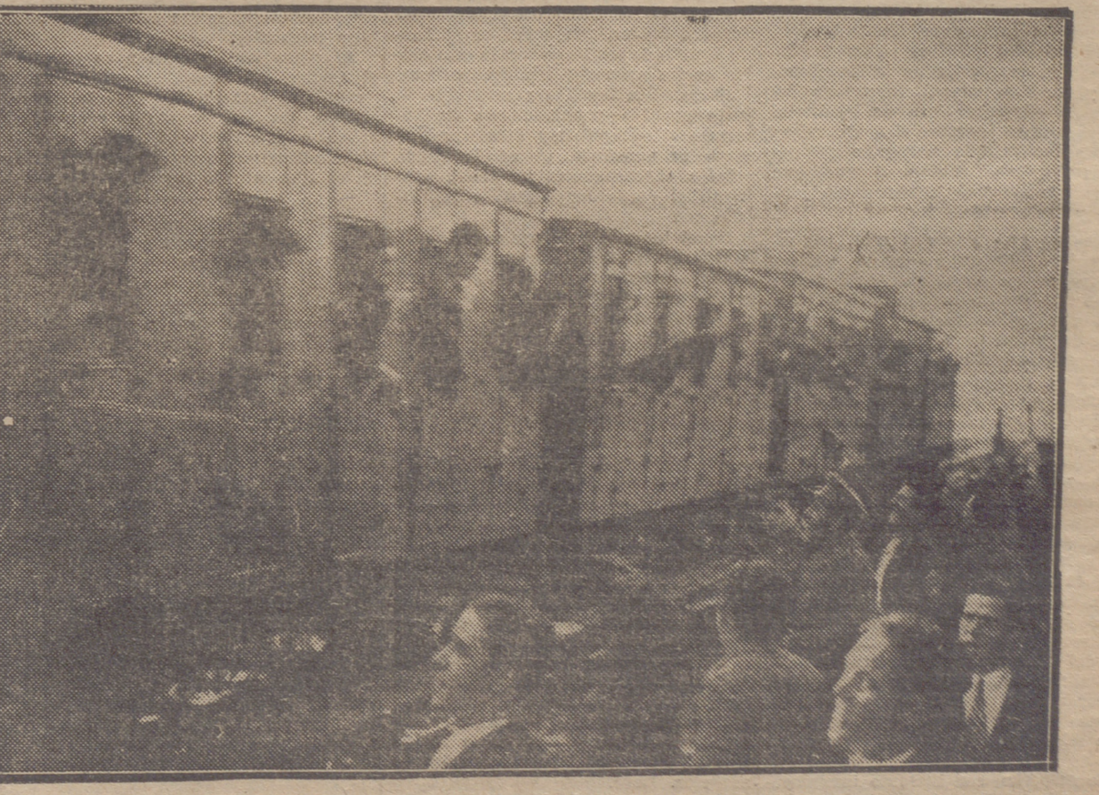
LOS SOLDADOS DE INFANTERÍA QUE REGRESAN DE ASTURIAS, A CUYO PASO SONARON CALUROSOS APLAUSOS Y VITORES.