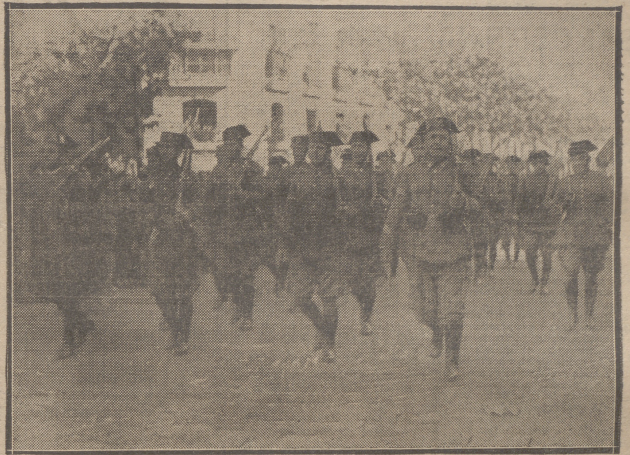
LA GUARDIA CIVIL, QUE DESFILO ENTRE GRANDES OVACIONES, A SU PASO FRENTE A LA TRIBUNA DE AUTORIDADES.

Con un día magnífico de sol verificóse en la mañana de ayer la fiesta organizada por las autoridades militares, en homenaje al Ejército español y más concretamente a los soldados que han atendido a la pacificación y restablecimiento de la normalidad en Asturias y Bilbao, con motivo de los pasados sucesos revolucionarios del mes de octubre.