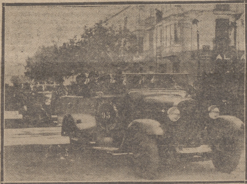
LOS VAGONES DE LAS FUERZAS DE ASALTO, A CUYO PASO SONARON CALUROSOS APLAUSOS Y VITORES.