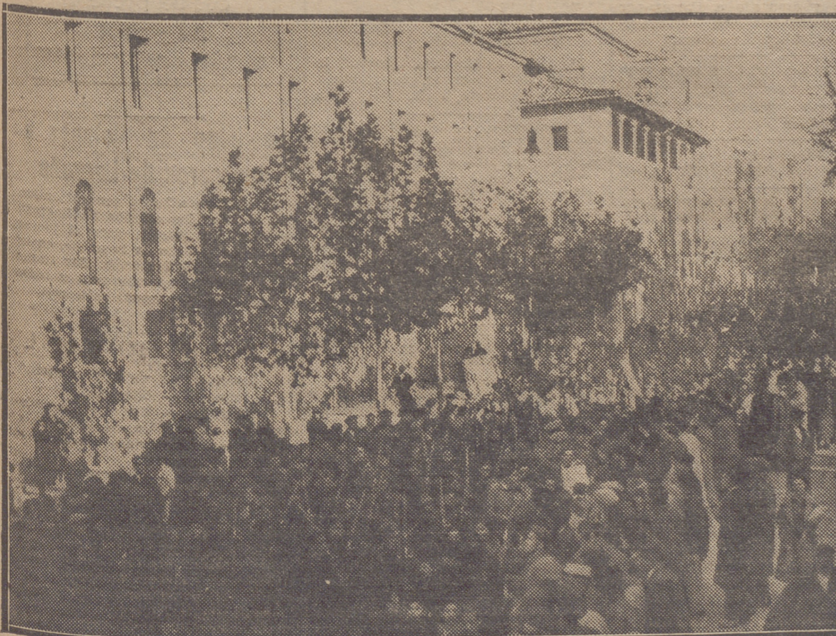
EL 24 DE INFANTERÍA RODEADO POR EL PÚBLICO QUE LO ACLAMABA. — DETRÁS MARCHABA EL 12 DE ARTILLERÍA, DEL QUE LAMENTAMOS NO HABER OBTENIDO UNA FOTO SUFICIENTEMENTE CLARA PARA SER REPRODUcida.