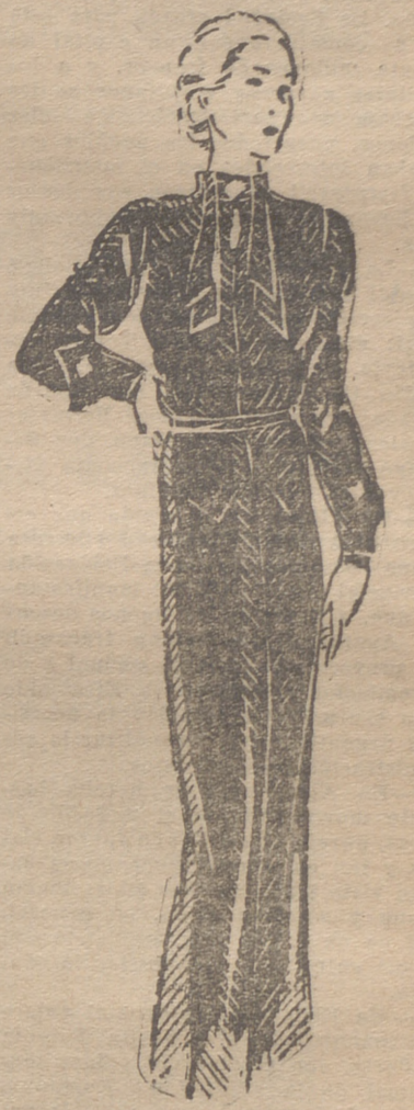
Vestido de mañana, de gamuza gruesa, en tonos nuevos

la mayoría de las mujeres. Es algo especial; un verdadero peinado elegante que se presta a maravilla para arreglarse en casa. Sólo requiere un poco de paciencia y aprender a cepillar el pelo en la dirección que deba seguir, ejercitándose un poco y dedicándose con regularidad por la mañana y por la noche a cepillar el pelo, pronto se hará fácil que los rulos queden en su lugar preciso.