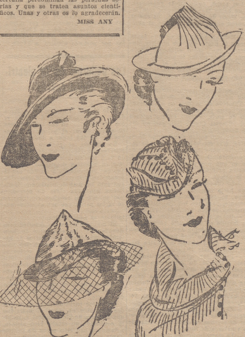
Fletero negro, adornado con una pluma de gallo, color bronce. Casco en "grabe" natural, adornado con un tul negro. — Sombrero de fletero rojo, rodeado con cinta de charol negra. Gorro de jersey, haciendo juego con la blusa.

La risa de la mujer resignada ablandaría las piedras.—Idem.