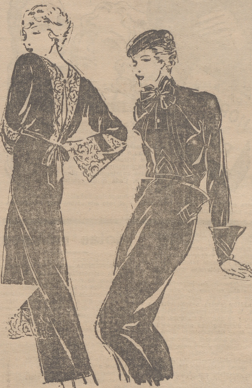
Vestido de djalap negro y puntilla, adornado con un lazo en la cintura, color rubí. — Vestido de djersa, adorna do con nervaduras verde crudo y botones negros.

Con gran tacto y diplomacia procuraba que ninguno de sus contenturios se aislara de la conversación general, y si sucedía alguna vez y comprendía que ese aislamiento era debido al temor de mezclarse en lo que no podía discutir, por no entenderlo, se dirigía a él de vez en cuando para que no hiciera un papel desairado,