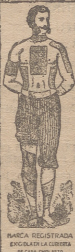
MARCA REGISTRADA EXIGIR EN LA CUBIERTA DE CADA EMPLASTO

Pida usted siempre un EMPLASTO WINTER con ésta marca en la cubierta.