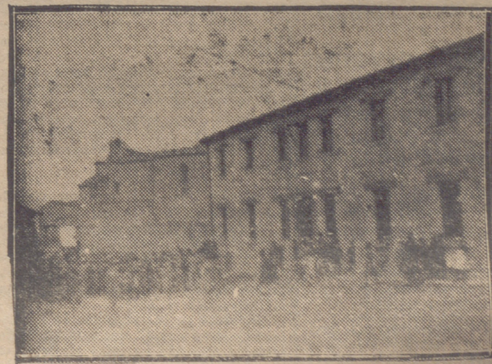
DESCUBRIMIENTO DE LA PLAZA QUE DA NOMBRE A LA PLAZA DE DOÑA PANTALEONA MELON, PLAZA COLOCADA EN EL EDIFICIO PARA ESCUELAS DONADO AL PUEBLO POR DICHA SEÑORA