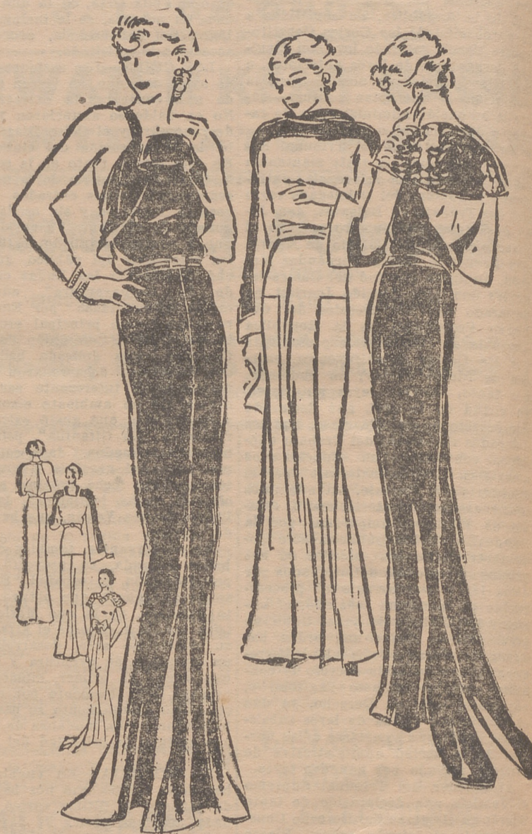
Vestido de noche, de satén negro, adornado con una pelerina de tul bordado con canutillo. — Traje para fiesta, de satén gris, adornado con satén negro. — Vestido de noche, de seda de fantasía negra, adornado en la parte alta con una aplicación de terciopelo negro formando godets.

Señora, Señorita, compre en esta casa su abrigo, su vestido y todo cuanto necesite, a precios increíbles. SAGASTA , esquina Hermanos Moroy Plaza Abastos