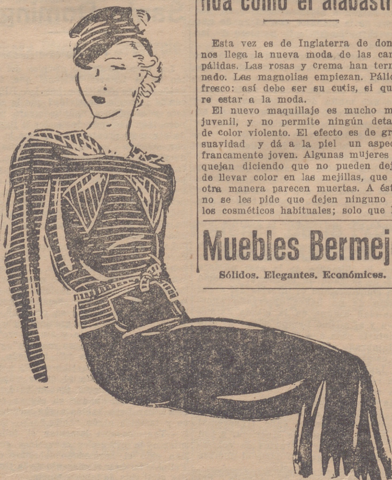
Blusa de crespón grueso negro con rayas blancas, sobre una falda de crespón negro.