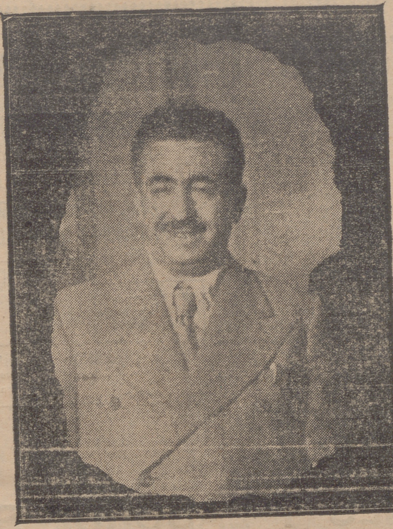
EL SEÑOR SALAZAR ALONSO