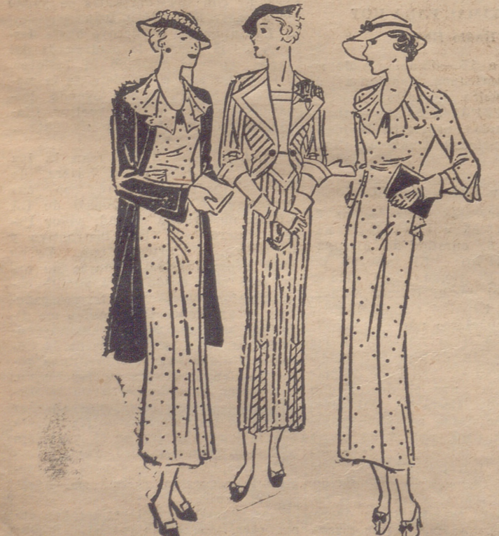
Huelga la explicación de estos trajes, que demuestran que la sencillez no está refutada con la elegancia