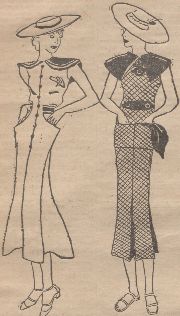
Vestido de piqué blanco. Cuello ancho de piqué rojo, con franjas blancas. Botones rojos. — Vestido de lino cuadrado azul marino y rojo. Cuello y cinturón azul marino. Botones del mismo tono