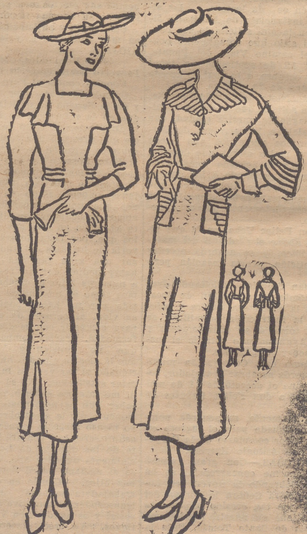
Trajecitos blancos, sencillos y elegantes.

Las pinzas de tender hay que hervirlas en agua y ponerlas a secar antes de estrenarlas. De este modo duran mucho tiempo.