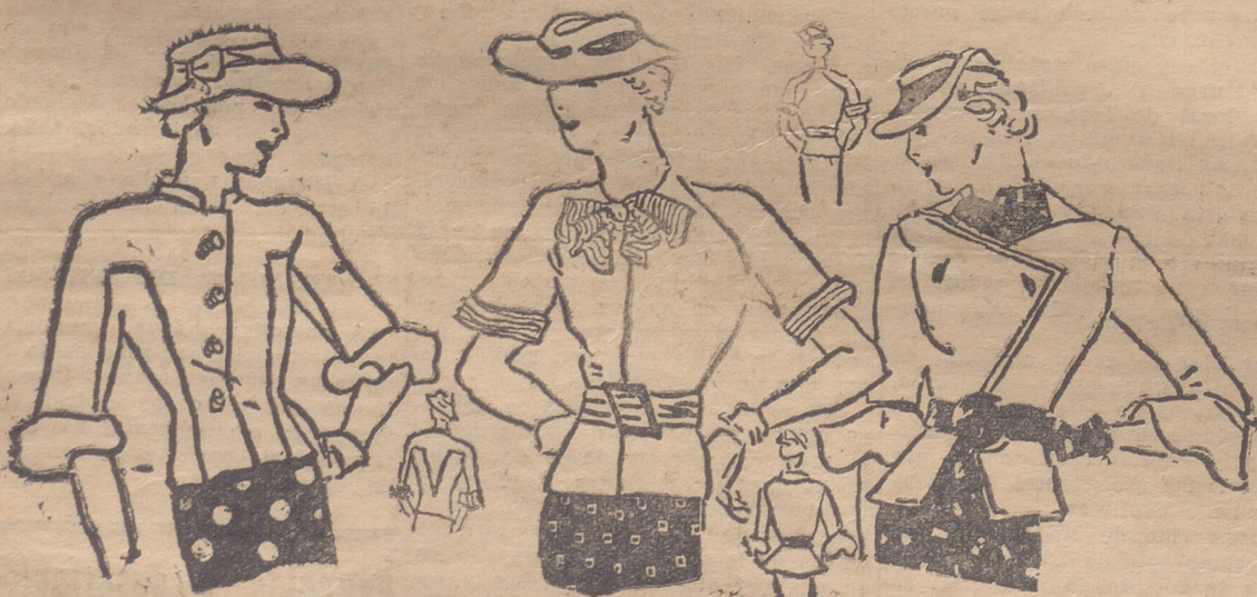
Vasca en piqué blanco, muy ajustado en el talle. Las mangas cortas forma kimono son más pequeñas que las de la blusa. Conchas nacaradas la cierran. — Vasca de piqué nido de abeja "grège". Corbata de piqué blanco, cuyo adorno se repite en las mangas. Cinturón de piqué incrustado de bandas de cuero azul marino. — Vasca de piqué blanco. Los clips de la blusa en forma de hoja.