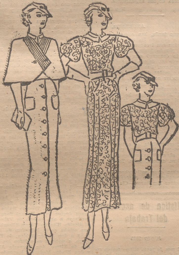
Conjunto transformable, compuesto de una falda azul marino, abotonada y con bolsillo. Capa pospunteada formando los pespunte puntos por detrás. Suprimiendo la capa aparece una blusa de crepón, impreso en azul, blanco y amarillo. Si se quita la falda queda un trajeito muy elegante