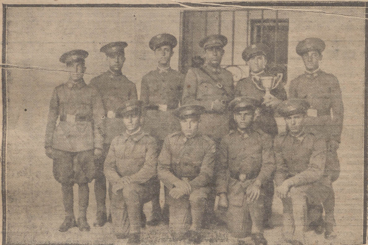
PATRULLA DEL REGIMIENTO DE INFANTERIA DE BALEN GANADORA DEL PRIMER PREMIO EN EL CONCURSO DE TIRO VERIFICADO RECIENTEMENTE EN VITORIA.

El anuncio en este periódico es la más eficaz propaganda de los productos y el incremento de las ventas