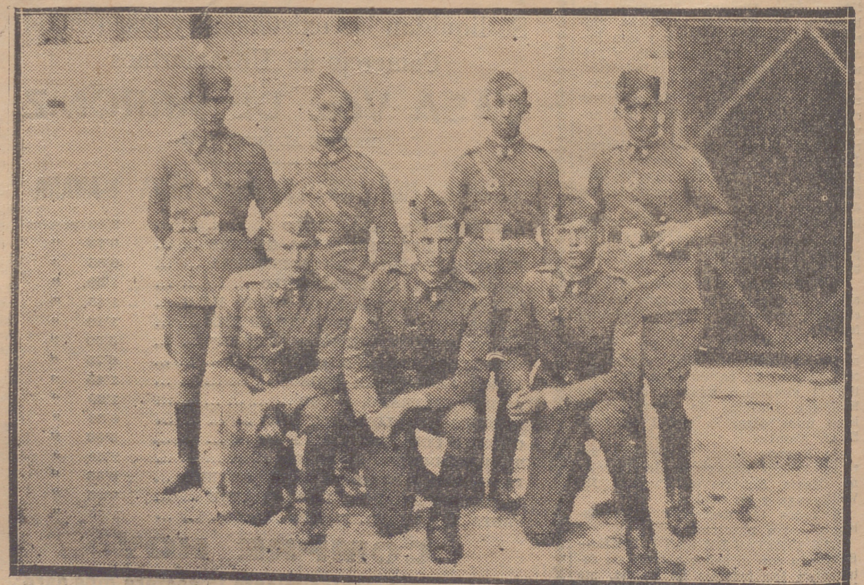
PATRULLA DEL 12 DE ARTILLERIA DE ESTA GUARNICION, QUE EN EL CONCURSO DE TIRO DE VITORIA OBTUVO EL CUARTO PREMIO.

También se publican los ascensos de jefes y oficiales de Caballería y de Intendencia y de oficiales, de oficiales terceros y suboficiales del Cuerpo auxiliar de oficinas militares.