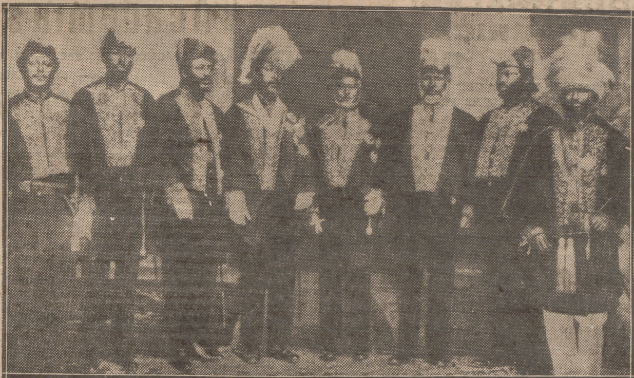
EL GOBIERNO DE ABISINIA

Hoy se repundrá "Oro y marfil", de los mismos autores y también obra conocida del público logroñés, pero verán ustedes como hoy también la obra parece de primera postura y el