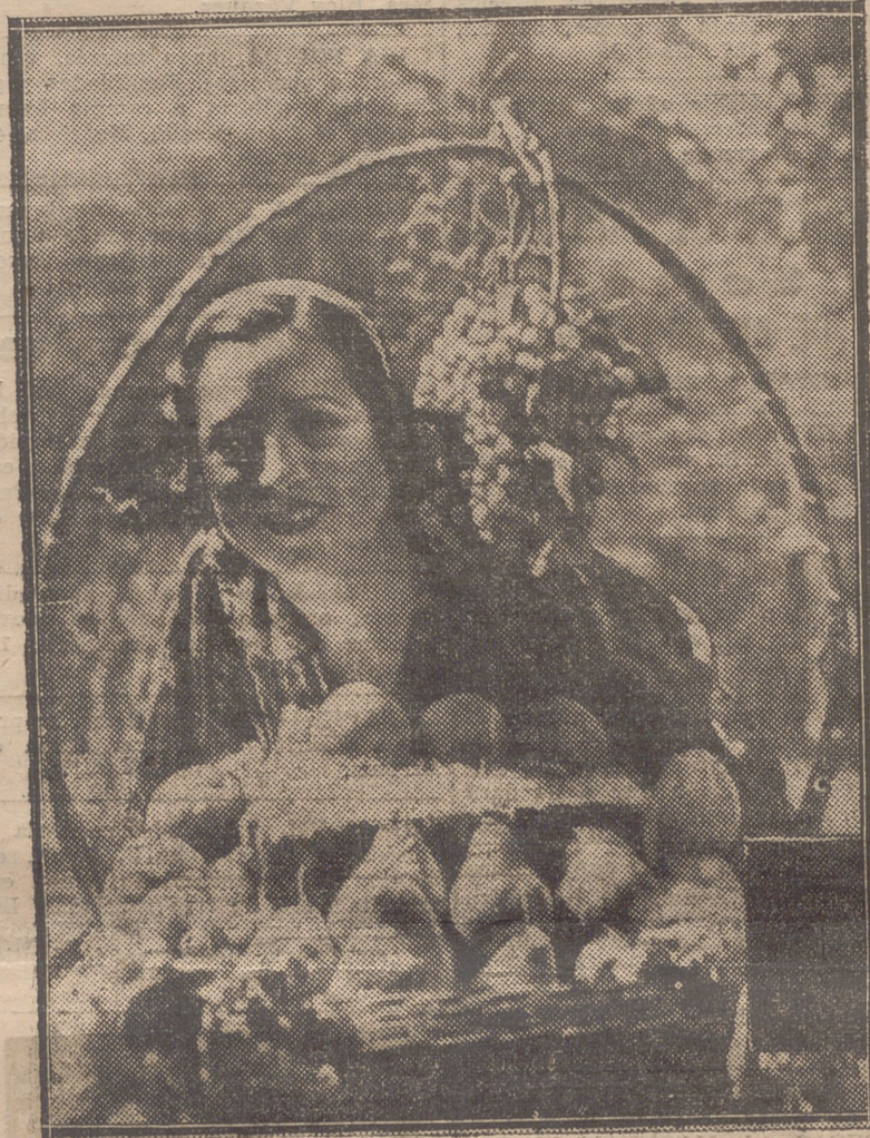
DE LA EXPOSICION DE ARAGON Y RIOJA EN MADRID.—UNA BELLA EXHIBICION DE OPTIMOS PRODUCTOS REGIONALES

A continuación S. E. el señor Presidente de la República examinó fijándose con extraordinario interés, una