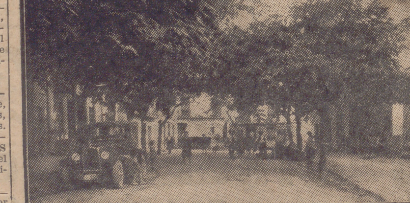
ARNEDO.—GLORIETA DE CELSO DIAZ

En el frontón ha habido bonitos partidos de pelota que fueron presenciados por numeroso público y muy aplaudidos los pelotaris.