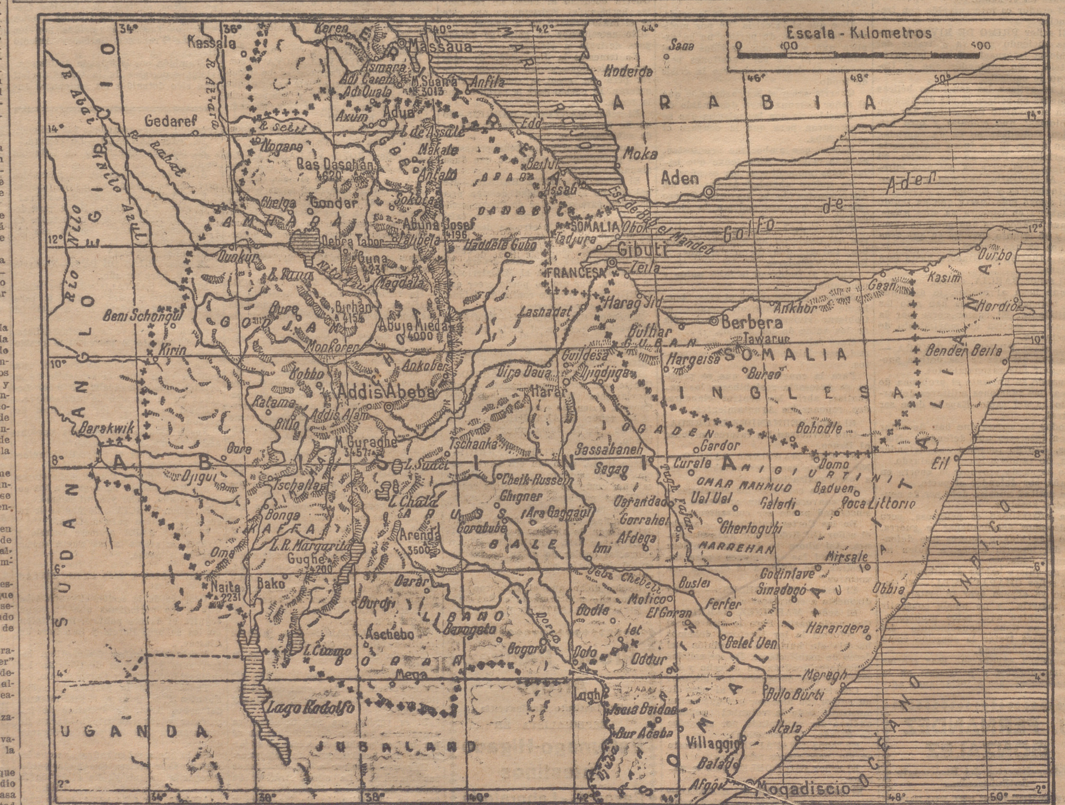
MAPA DE ABISINIA Y PAISES FRONTERIZOS. LA FRONTERA ETIOPE-ITALIANA NO SE MARCA POR ESTAR SIN DELIMITAR. TAL TAL HA SIDO CONSIDERADA RECIENTEMENTE TERRITORIO ETIOPE.

El Almirantazgo ha distribuido entre los trabajadores de los Astilleros equipos de defensa contra los ataques aéreos.