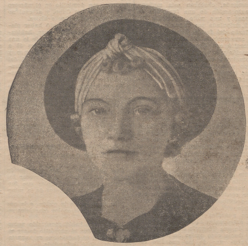
Sombrero de fieltro negro y terciopelo azul turquesa, para vestido de tarde.

Es indudable que las verdaderas musas inspiradoras de la actual moda de tener una línea grácil, una silueta alargada, son las estrellas de la pantalla. Todas las muchachas las miran con envidia. ¡Oh, qué cuerpos tan esbeltos! ¡Qué facilidad de movimientos! Inmediatamente las que creen tener algunos gramos de grasa superflua, luchan denodadamente para eliminarlos, empleando para ello los medios más duros y contundentes. "¡Quién pudiera tener—nos decía una señora amiga nuestra—una línea tan "natural" como las artistas cinematográficas!" ¡Ah! Aquí está la equivocación de la mayoría de las mujeres. Precisamente en creer que la línea de las estrellas es "natural", es decir, que son elegantes "porque sí", sin tener que hacer ningún esfuerzo para ello. Sin embar-