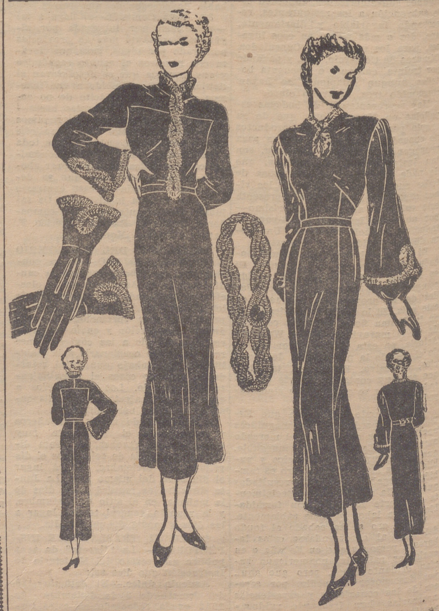
Dos sencillos trajes negros o azul marino, adornados con galones blancos.

Cuando se titubea, si se teme sucumbir a la tentación de la novedad aun cuando ésta no nos sienta bien, convendrá consultar a la modista, dejándose guiar por ella. Es de tener en cuenta que el interés de ésta es el de vestirnos y de aconsejarnos el mejor sombrero posible, a fin de que nuestras amigas nos pregunten dónde hemos adquirido aquel