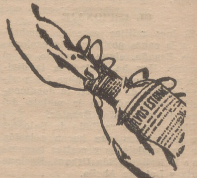
Fig. n.º 4

En su parte lateral, adaptada al cuello de la botella, se ha practicado un corte con dos puntas, que tirando por cualquiera de ellas quedará la cápsula convertida automáticamente en un tapón de rosca. Véase figura n.º 3 y 4.