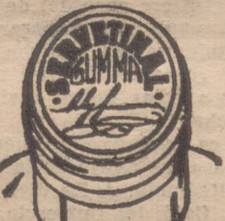
Fig. n.º 2