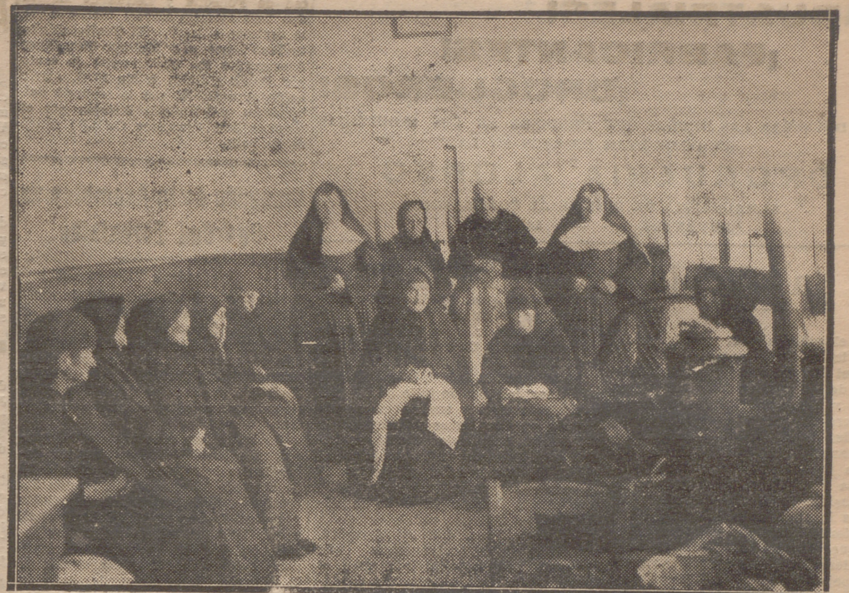
EN LAS HERMANITAS DE LOS POBRES.—ANCIANAS DESAMPARADAS QUE SE REFUGIAN EN EL AMABLE AMBIENTE DEL ASILO, Y EN EL TRATO CARINOSO DE LAS MONJITAS, CONVERSAN Y HACEN COSTURA AL AMOR DE LA ESTUFA