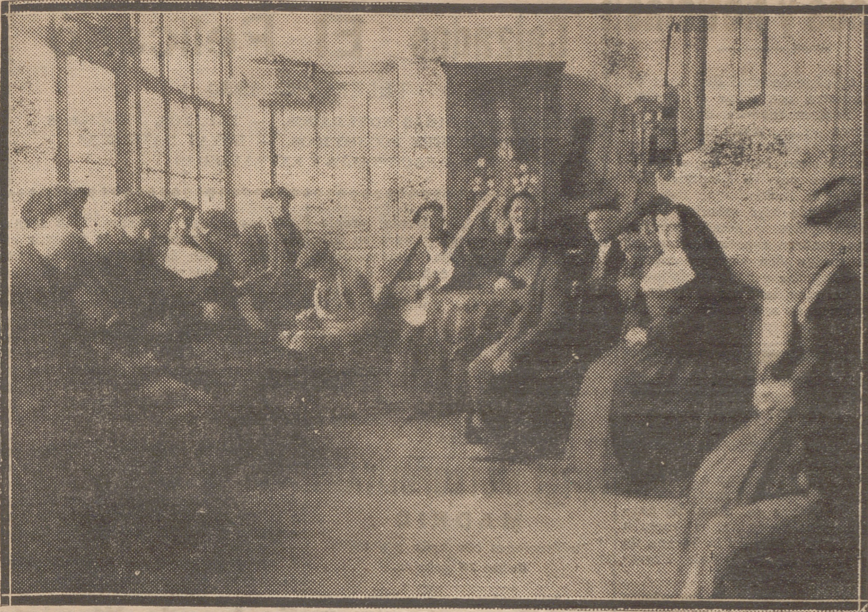
EN LAS HERMANITAS DE LOS POBRES.—LOS ANCIANOS ASILADOS HABLAN, LEEN Y HASTA HACEN UN POCO DE MUSICA CON LA GUITARRA EN EL TEMPLADO Y ALEGRE AMBIENTE DE UNA GALERIA ENCRUSTALADA QUE RECIBE EL SOL DEL MEDIODIA