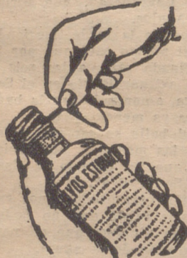
Fig. n.º 3