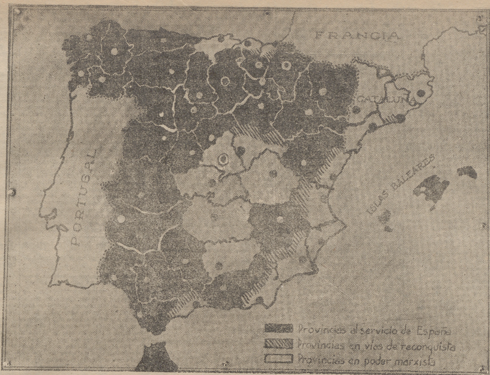
GRAFICO EN QUE SE SEÑALA LA EXTENSION DEL MOVIMIENTO DE SALVACION NACIONAL Y EL ARRULLADOR AVANCE DE LAS FUERZAS

Y ahora, un consejo: para los "sordos" que no quisieron oír, y para los "ciegos" que no quisieron ver". Sabed, que un ruso, está al frente del gobierno fantasma de Madrid, y que el no mudáis de táctica vosotros seréis las primeras víctimas de los logreros, que mi farsa iba a retratar; pero que no he podido ter-