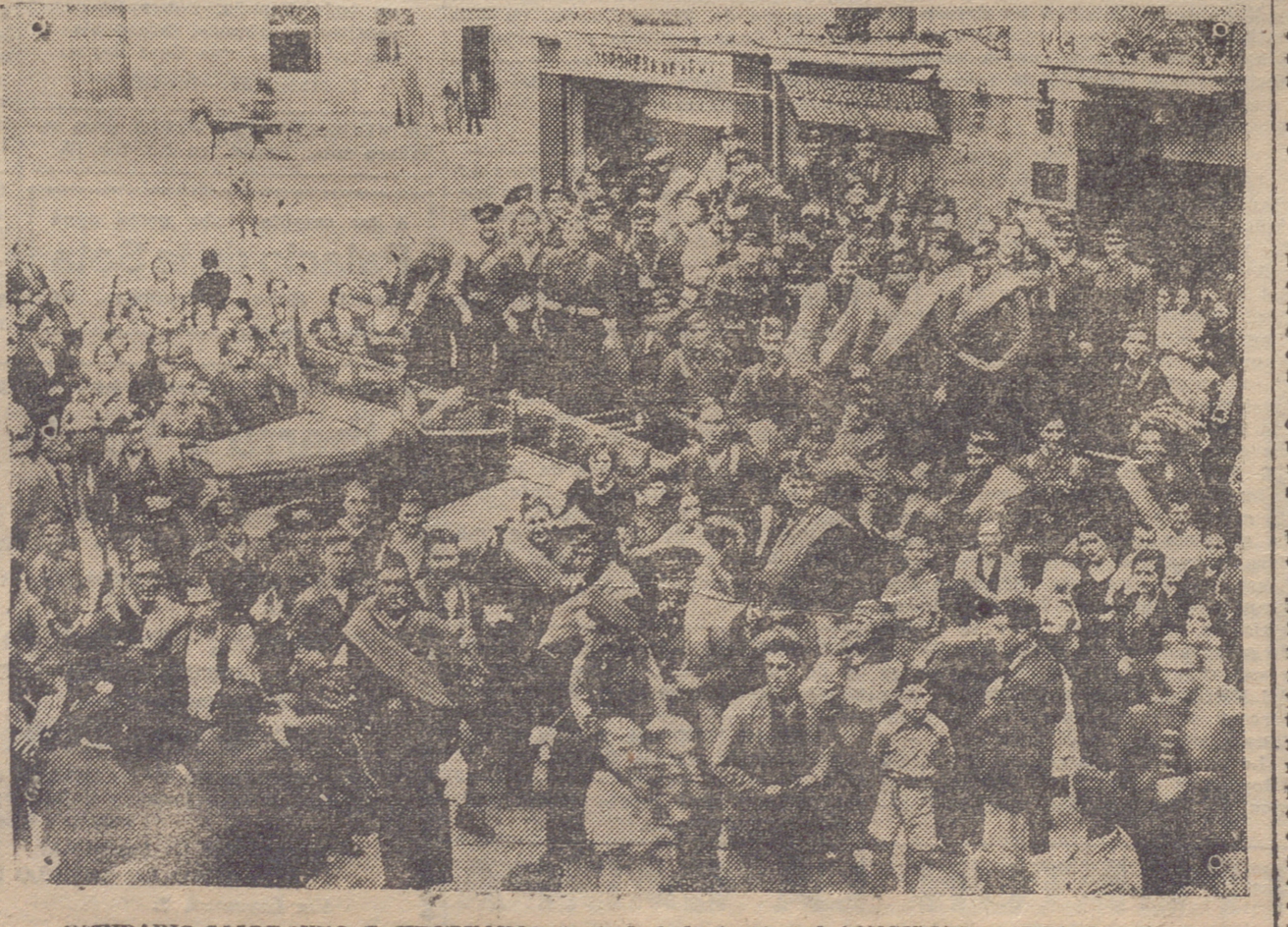
VECINDARIO SALUDANDO Y VITOREANDO A LOS SOLDADOS, FA LANGISTAS O REQUETES, A SU PASO POR LAS CALLES DE LOGROÑO