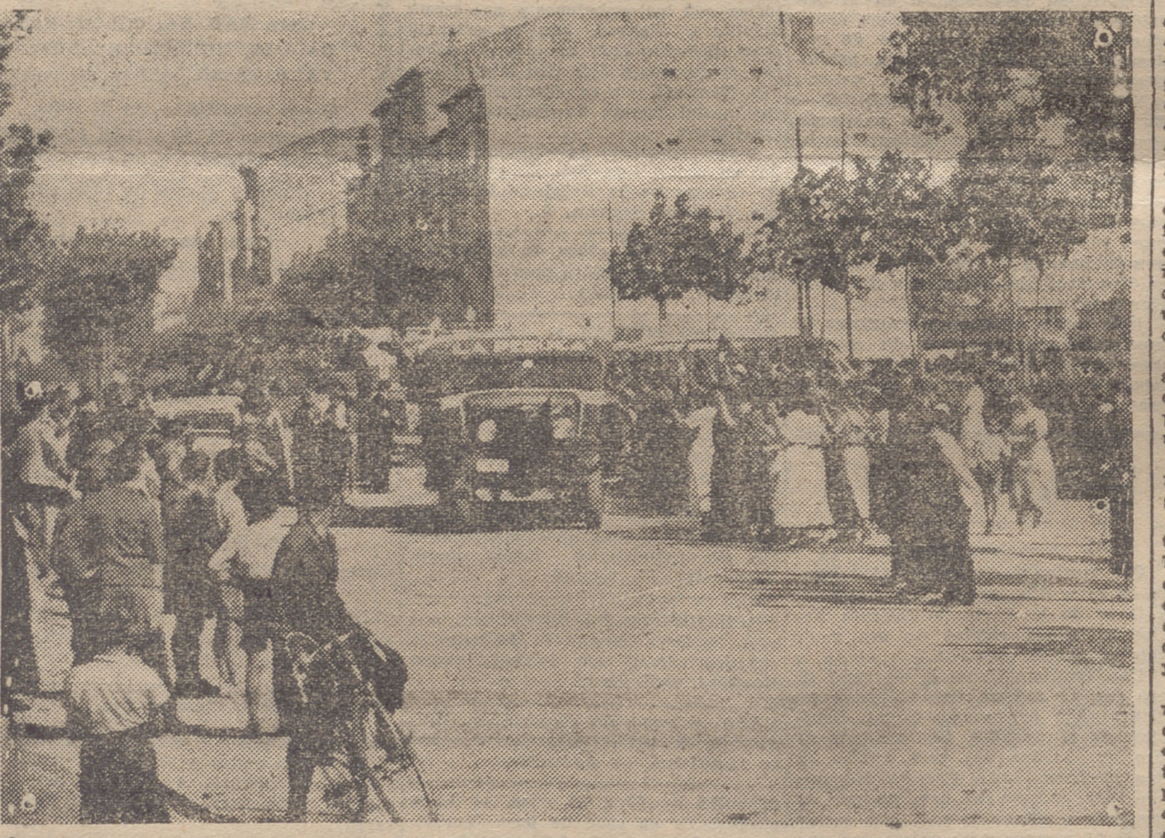
ANIMADO ASPECTO QUE OFRECEN LAS CALLES DE ESTA CIUDAD CUANDO LAS FUERZAS SE DISPONEN A REALIZAR ALGUN SERVICIO