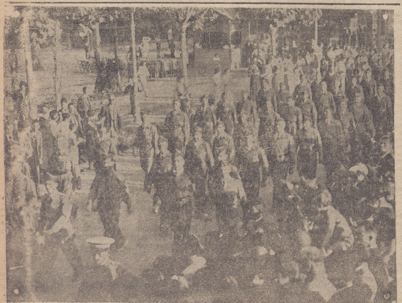
LOS VOLUNTARIOS DE CLAVIJO DESFILANDO MARCIALMENTE ANTE EL GENERAL COMANDANTE MILITAR, DESPUES DE HABER SIDO REVISTADOS POR ESTE