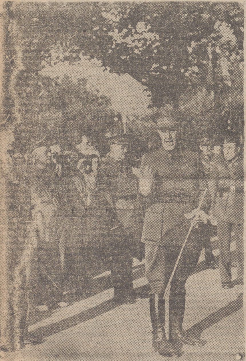
EL EXCMO. SEÑOR GENERAL DON ELISEO ALVAREZ ARENAS, DIRIGIENDO UNA PATRIOTICA ALOCUCION A LOS VOLUNTARIOS DE CLAVIJO

Todos los ruegos y propuestas que se han consignado fueron tomados en consideración para su paso a las Comisiones correspondientes, e aprobados en firma.