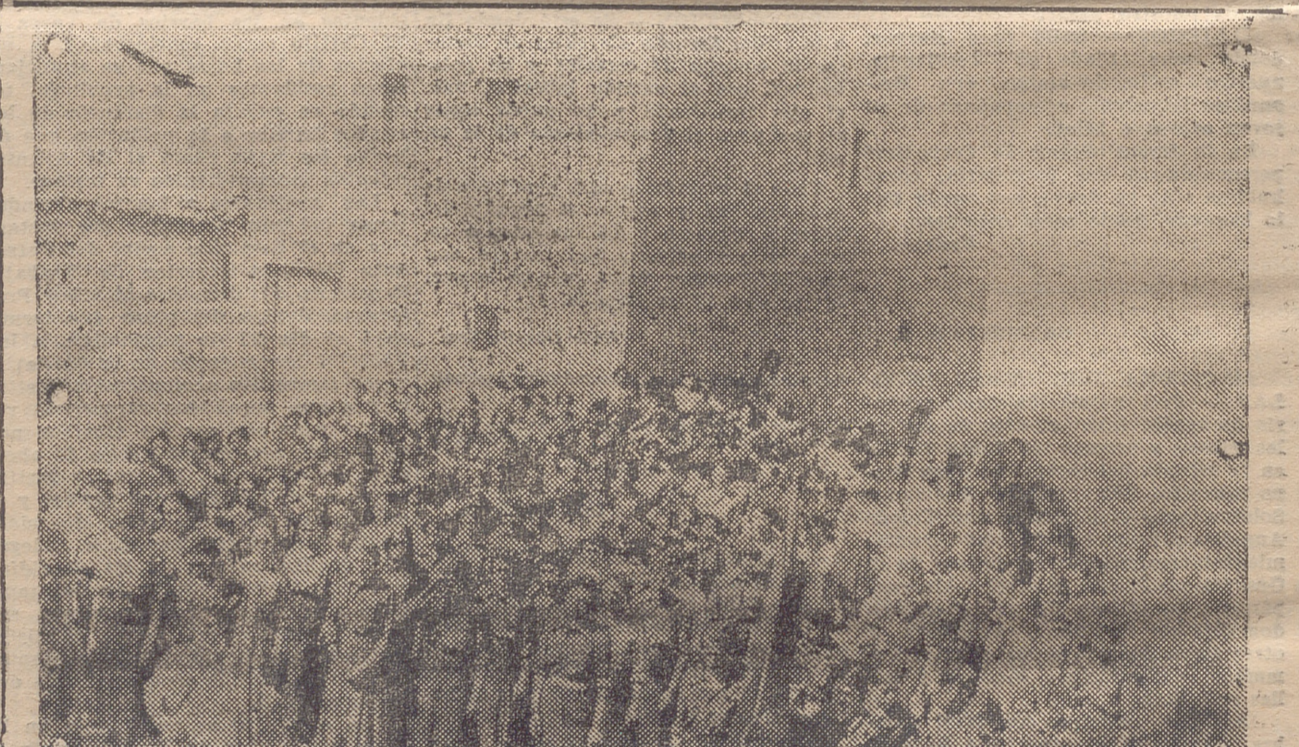
CIRUELA. — UN ASPECTO DE LA MISA DE CAMPAÑA CELEBRADA EL DOMINGO POR REQUETES Y MARGARITAS DE SANTO DOMINGO Y PUEBLOS LIMITOPES