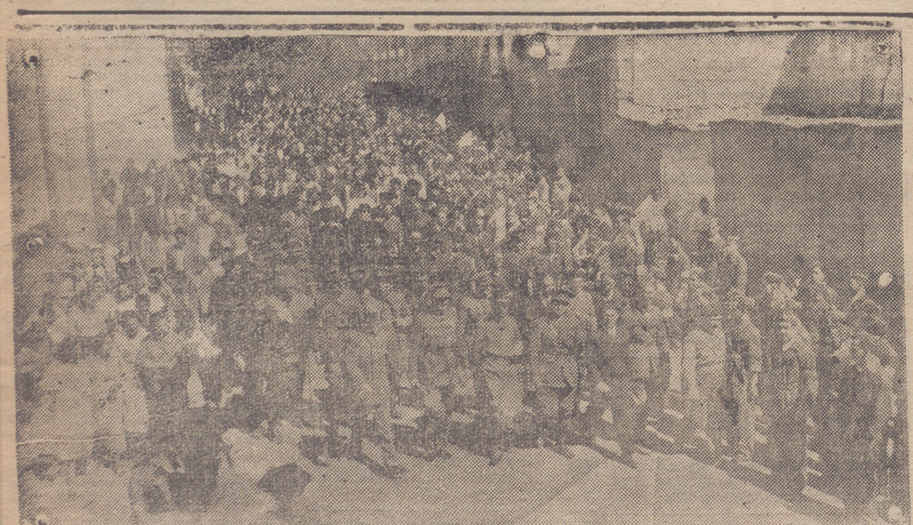
CALAHORRA. — LOS EXCMOS. SEÑORES GENERAL COMANDANTE MILITAR Y GOBERNADOR DE LA PROVINCIA, ACOMPAÑADOS DEL ILMO. SEÑOR OBISPO DE LA DIOCESIS, ALCALDE Y OTRAS AUTORIDADES, DURANTE LA VISITA QUE REALIZARON EL PASADO LUNES A DICHA CIUDAD PARA ASISTIR A LOS ACTOS CON LOS QUE SE CONMEMORAN LA FIESTA DE LOS MARTIRES PATRONOS DE LA MISMA