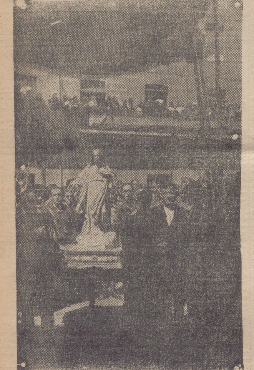
CALAHORRA. — LA IMAGEN DEL CORAZON DE JESUS QUE EL PASADO LUNES FUE LLEVADA PROCESIONALMENTE AL AYUNTAMIENTO E INSTALADA DE NUEVO EN EL SALON DE SESIONES, DE DONDE HUBO SIDO RETIRADA POR EL PRIMER AYUNTAMIENTO DE LA REPUBLICA

En la imposibilidad de hacerlo personalmente, se publica en este periódico para conocimiento de los interesados, haciéndoles saber que de no reunir las condiciones establecidas en la mencionada circular, tendrán que percibir sus haberes personalmente en esta Sección, y de no ser así serán reintegrados al Tesoro.