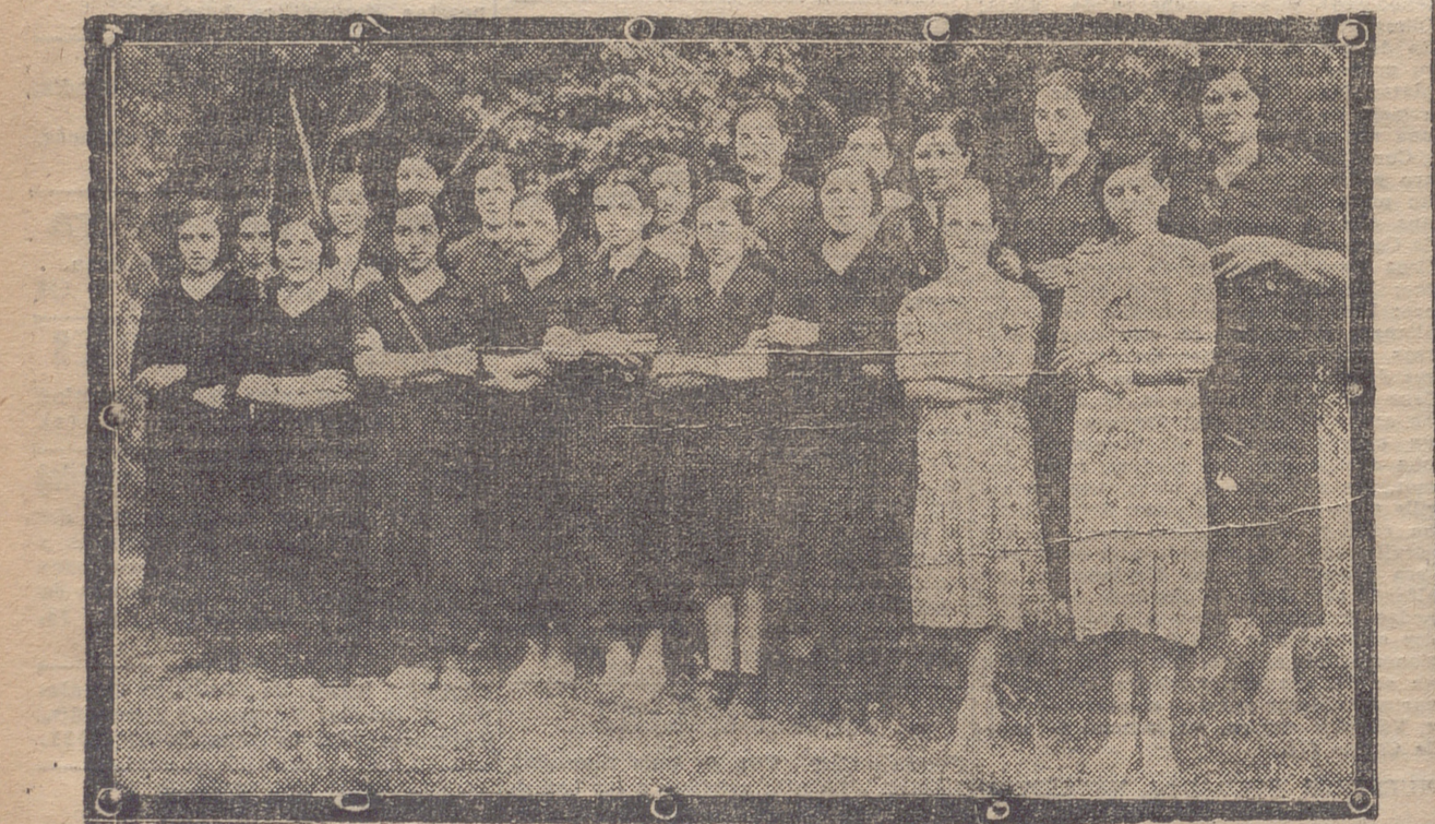
MUNILLA. — GRUPO DE BELLAS FALANGISTAS QUE ASISTIERON A LA COLOCACION DE LOS CRUCIFIXOS EN LAS ESCUELAS.

Un día los aires de España, cruzará pronto un avión que, al mismo tiempo, que transporte el nombre de Cala-