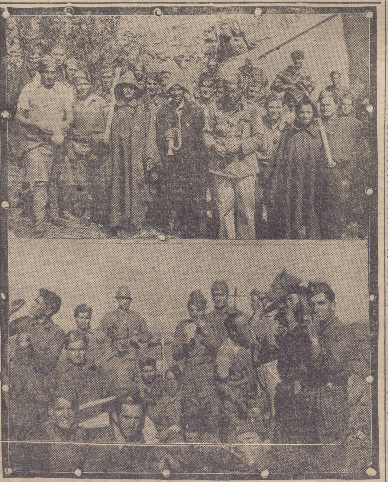
Momentos de la celebración de San Mateo por los soldados del 12 de Artillería que se encuentran en el frente