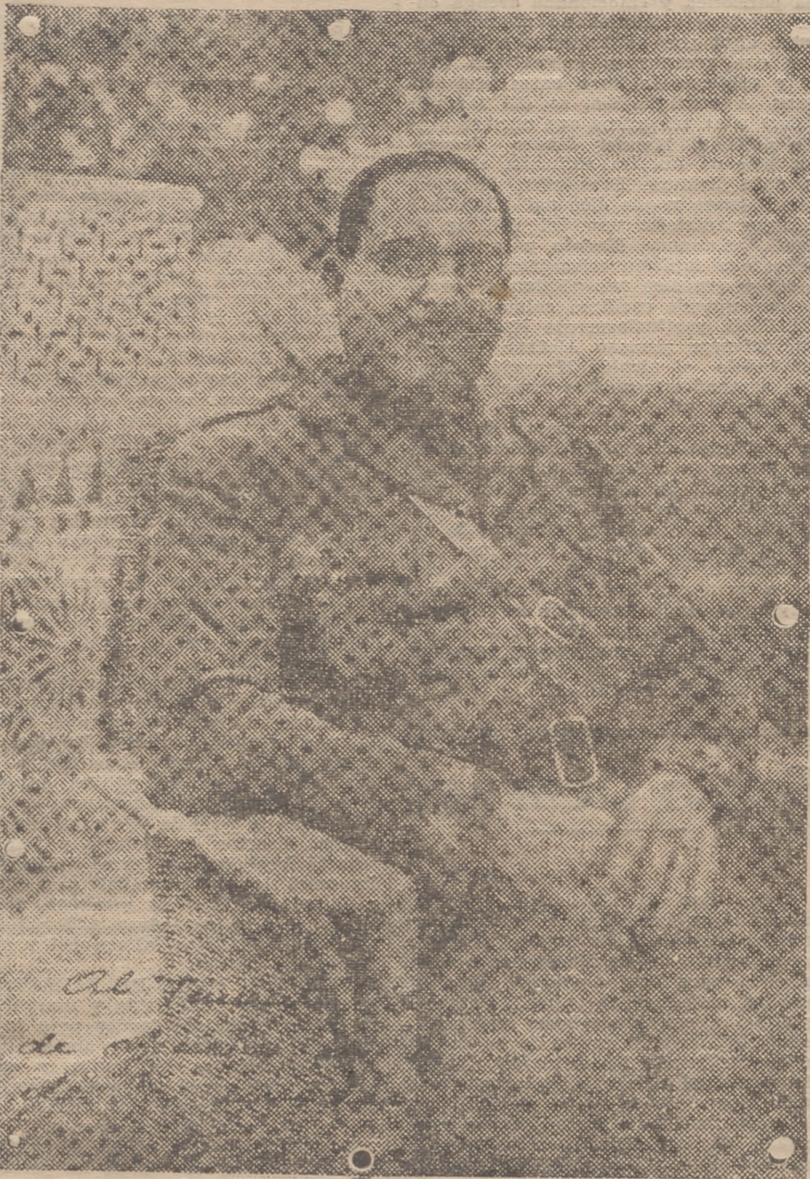
EL CORONEL ARANDA, ASCENDIDO A GENERAL POR SU HEROICA DEFENSA DE OVIEDO

ACCIDENTE AUTOMOVILISTA. — Cuando varios vecinos de esta ciudad se dirigían anoche en automóvil a Logroño, a unos quinientos metros esca-