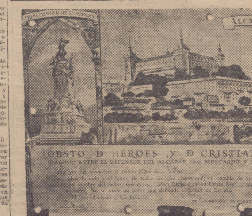
ALCAZAR DE TOLEDO