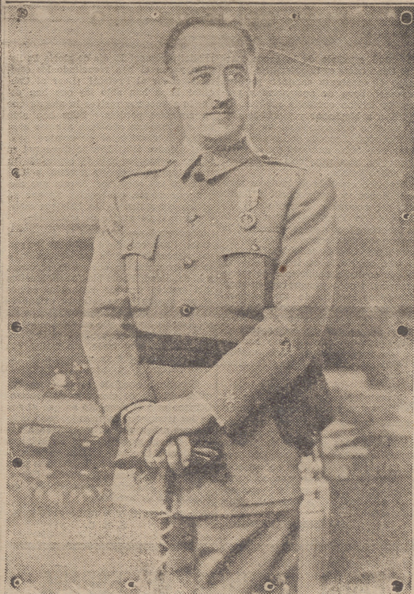
EL GENERALISIMO FRANCO

Es la grandeza de España. ¡Arriba España! ¡Arriba España!