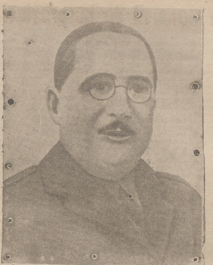
EL GENERAL ARANDA

CUYA SERENIDAD Y FIRMEZA SOSTUVIERON EL ANIMO DE OVIEDO, LA MARTIR, EN EL MAS DURO ASIEDO DE QUE SE TIENE MEMORIA