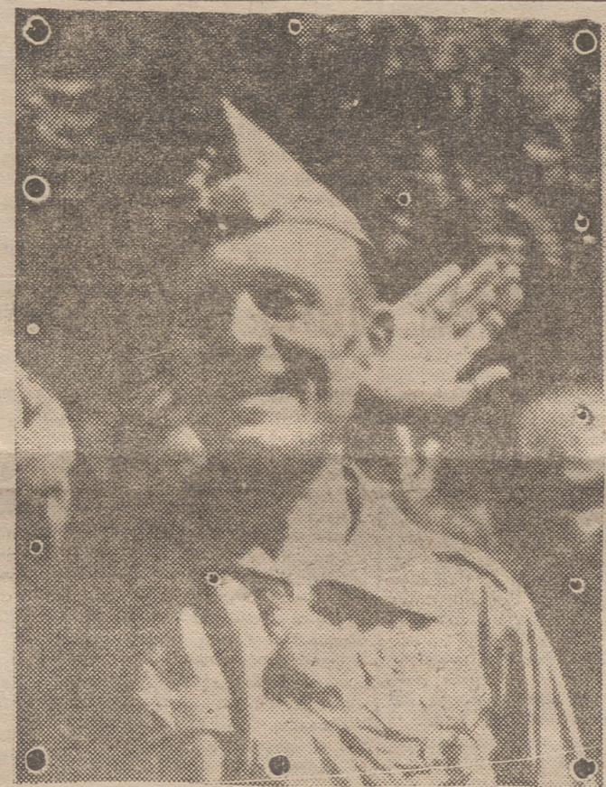
EL GENERAL MILLAN ASTRAY

En España no hay problema religioso, pues la totalidad del país es católica y nuestro episcopado, en general, es ejemplo de virtudes y de apartamientos de las cosas temporales. La historia contemporánea de nuestra nación, desvirtuando los años de República, es una muestra de comprensión y de armonía en las relaciones de la Iglesia y Estado.