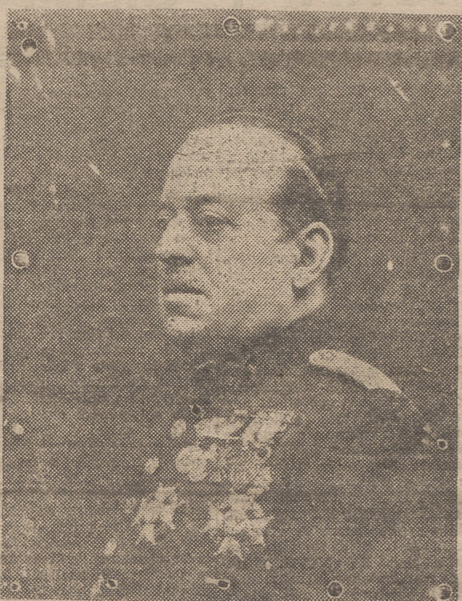
EL GENERAL SANJURJO

Unos meses han bastado para que la Justicia del Nuevo Estado haya tenido manifestaciones de aleccionadora eficacia.--Por fin, los españoles dignos han podido aprender que el Pan, la Paz y la Justicia son palabras cuyo significado se proyecta en la realidad