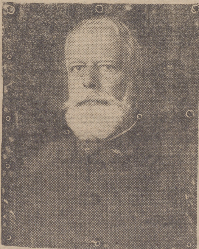
EL GENERAL CABANELLAS

PRESIDENTE DE LA EXTINGUIDA JUNTA DE DEFENSA NACIONAL