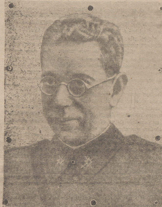
EL GENERAL MOLA

MALOGRADO ARTIFICE DE LA VICTORIA EN EL NORTE, CUYO EJERCITO MANDABA EN JEFE