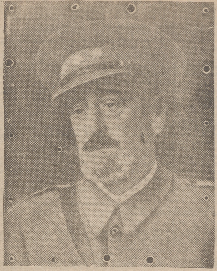
EL GENERAL MOSCARDO

JEFE DE LA GUARNICION DEL ALCAZAR DE TOLEDO, CUYA HEROICA RESISTENCIA ES EJEMPLO EN LA HISTORIA