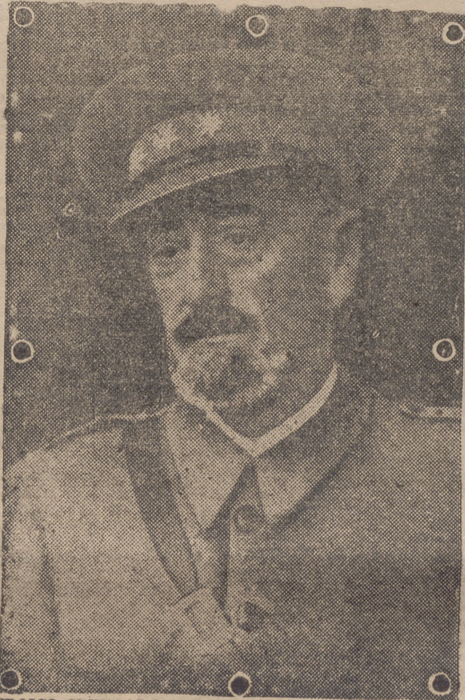
EL HEROICO GENERAL MOSCARDÓ, JEFE DE LOS DEFENSORES DEL ALCAZAR

El Alcázar de Toledo es hoy el más glorioso de nuestros mutilados. Su herida sangrienta dará a la Nueva España la más noble, la más honrosa de sus cicatrices, que son la ejecutoria de sus esclarecidas virtudes. La frase con que el coronel Moscardó dió la novedad al Generalísimo Franco, sublime en su sencillez, es para el escudo de la Patria la más significativa leyenda. También en la España que triunfa, que se recobra y que afirma su destino imperial, sobre el sacrificio está la victoria y la victoria le es tan debida a su heroísmo que en la España digna que trabaja, que lucha, que sufre y que vence: "No hay novedad". ¡Arriba España! ¡Viva el Ejército Español! ¡Viva el Caudillo! ¡Viva el General Moscardó!