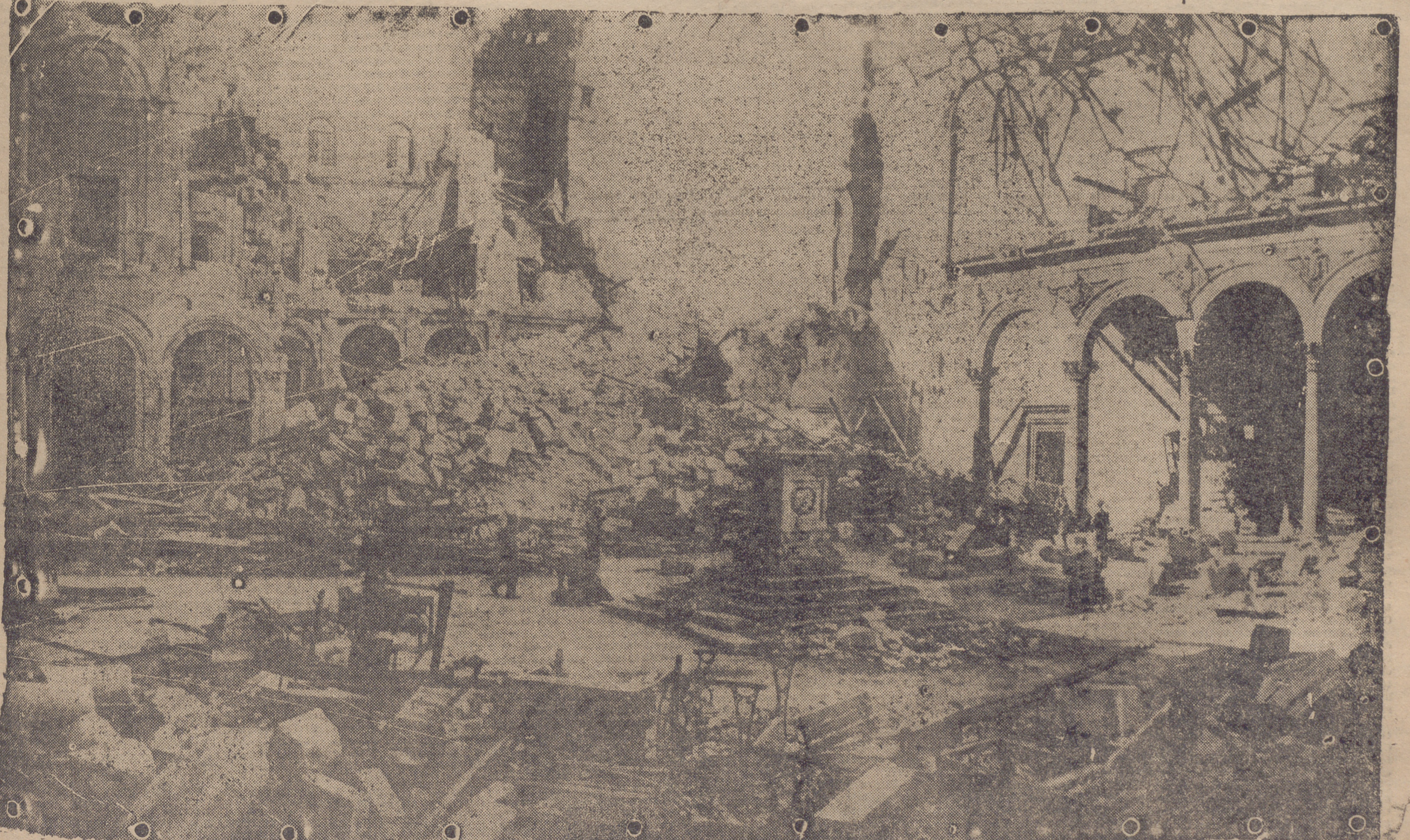
Vista del Interior del Alcázar, en la que se pueden apreciar los destrozos causados por la dinamita, que abrió brecha en sus muros

las alcazabas, las fuerzas Regulares salieron del pueblo de Barrocalejo en dirección bélica a Torrijos, villa importantísima que nuestro Ejército ocupó sin novedad. Por la mañana de ese mismo día, el Generalísimo Franco llegó con su Estado Mayor a Naval Moral de la Mata, celebrando un cambio de impresiones con Yagüe y otros jefes y oficiales sobre el terreno de las operaciones. El 30 de agosto de 1936, el nuestro laureado teniente coronel Tella, decidió ocupar Oropesa y Torralba, lo cual logró después de violentos tiroteos de las hordas anarco-marxistas del Frente Popular, las cuales no se resignaban de buen grado a perder posiciones tan importantes; mas, al fin, los rojos tuvieron que huir a la desbandada, dejando en nuestro poder docenas de vehículos y de ame-