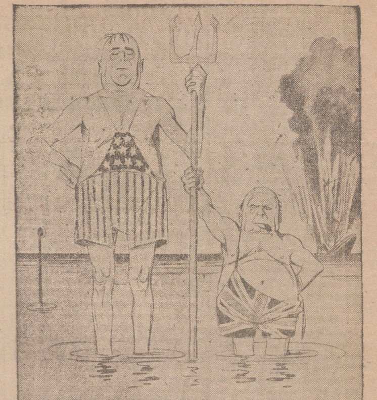
LOS DOS NEP-TUNS QUE SE HAN ERIGIDO EN CUSTODIOS DE LA LIBERTAD DEL OCEANO.