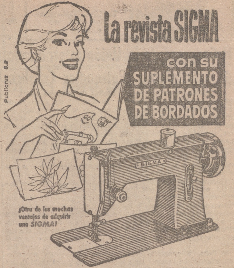
Otro de los muchos ventajas de adquirir una SIGMA!

Lo que eran hermosos trigos y verdes viñas quedaron reducidos a un montón de hierbas tronchadas y esparcidas, como segadas en desorden, y las cepas convertidas en unos troncos pelados y tristes que parecen cruces de un cementerio.