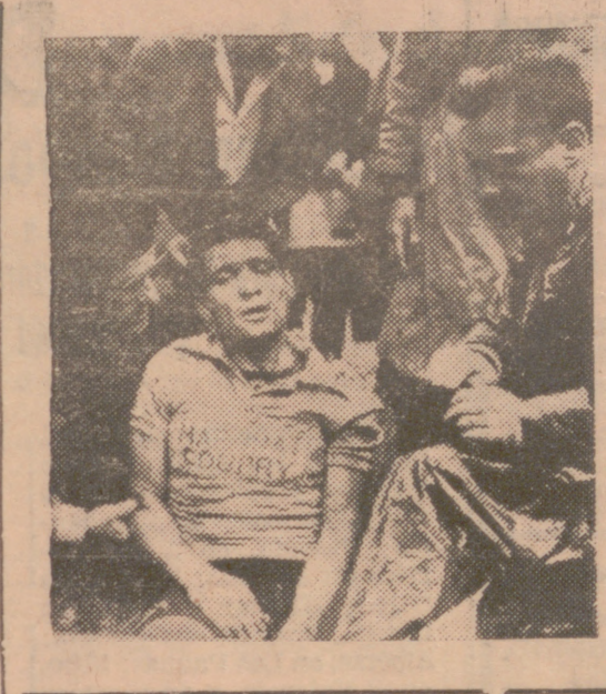
El «Tour» de Francia