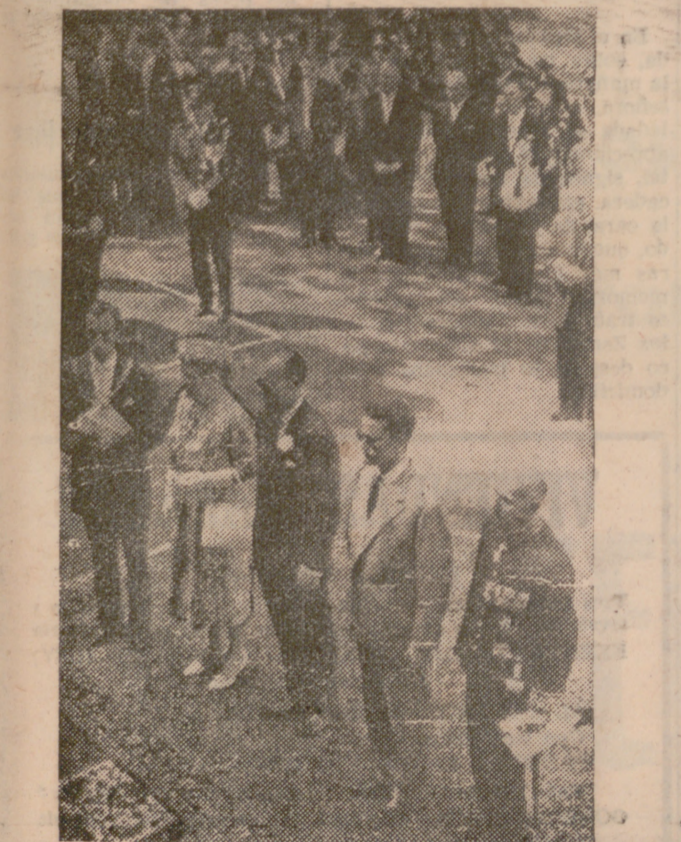
En nuestra foto vemos al rey Balduino acompañado de la reina Juliana de Holanda y el príncipe Bernardo guardando un minuto de silencio en el monumento a los caídos, en Heer.

mentan el programa son las normales en estos casos. Es de suponer habrá un principio de austeridad, pero más suave que en otros países. Debido a la situación económica española, felizmente no hay que apretar demasiado."