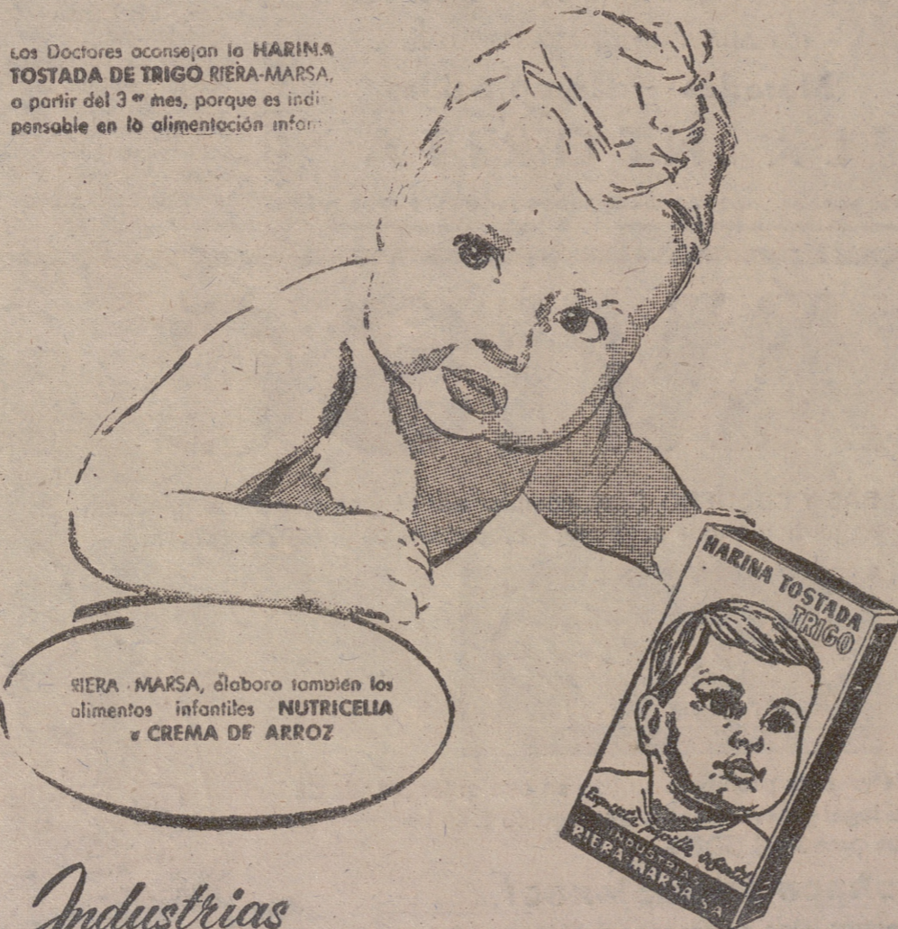
RIERA-MARSA, elabora también los alimentos infantiles NUTRICELIA y CREMA DE ARROZ

Los Doctores aconsejan la HARINA TOSTADA DE TRIGO RIERA-MARSA, a partir del 3º mes, porque es indispensable en la alimentación infantil.