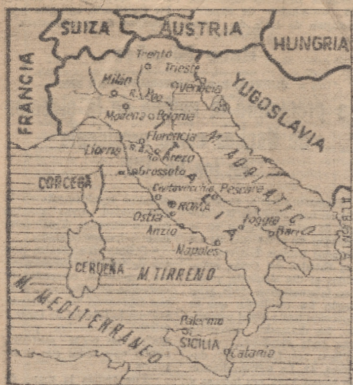
En el gráfico se señalan algunas de las ciudades más afectadas.

Cuarenta personas han perecido en las inundaciones de Panamá