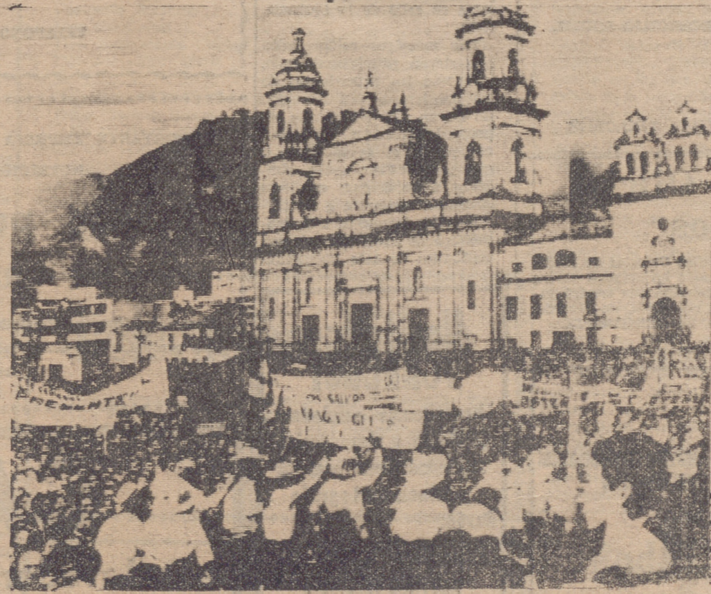
Cerca de 70.000 personas se reunieron en la Plaza de Bolívar, de Bogotá, para recibir y aclamar a los 86 maestros que han recorrido más de 1.600 kilómetros a pie, viajando desde Santa Marta, para reclamar el pago de sus sueldos. El penoso recorrido de los maestros recibió el nombre de la “Marcha del hambre”. En la fotografía vemos un aspecto de la gran concentración.